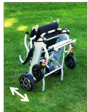
Silla plegada: 40cm

RESPALDO PLEGABLE Y REPOSABRAZOS ABATIBLES: