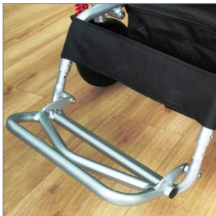
Reposapiés regulables en altura

REPOSAPIÉS REGULABLES EN ALTURA Y EXTRAÍBLES