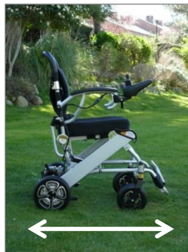
Reposapiés plegado: 80cm