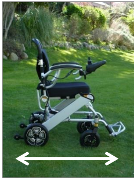
Silla abierta: 90cm